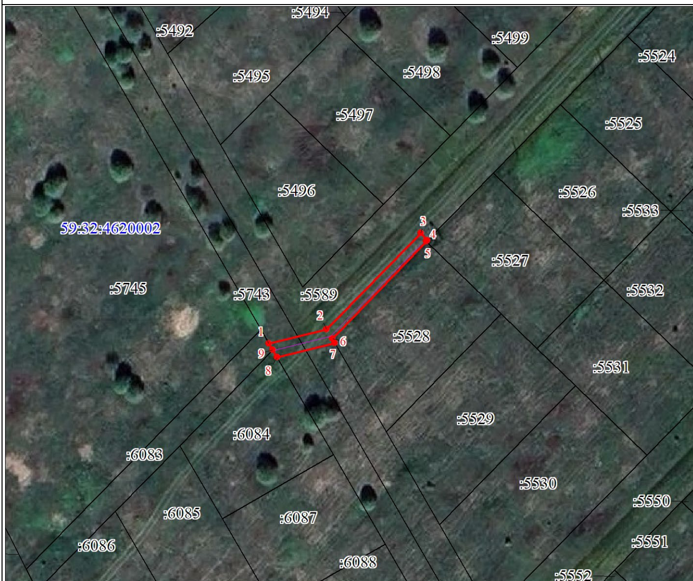
План границ объекта